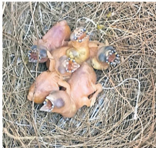
Aan de papillen in de bek kun je zien welke kleuren de vogel krijgt.

APELDOORN - Cor Balk uit Apeldoorn zette een mooie prestatie neer op de Mondial, de wereldvogeltentoonstelling in Zwolle in januari. Voor de tweede keer won hij een wereldtitel met een stam Gouldamadine blauwe zwartkop paarsborst mannen. Zo'n stam moet bestaan uit vier identieke vogels qua type, formaat, kleurstelling en conditie. Cor: "Deze vogels vallen onder de Australische prachtvinken. Het is een moeilijke vogel om te kweken, omdat er meestal wel iets aan een vogel mankeert, maar wat ik doe wil ik goed doen." Met een inzen-